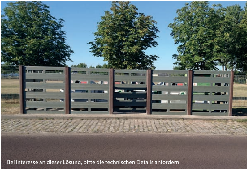
Bei Interesse an dieser Lösung, bitte die technischen Details anfordern.